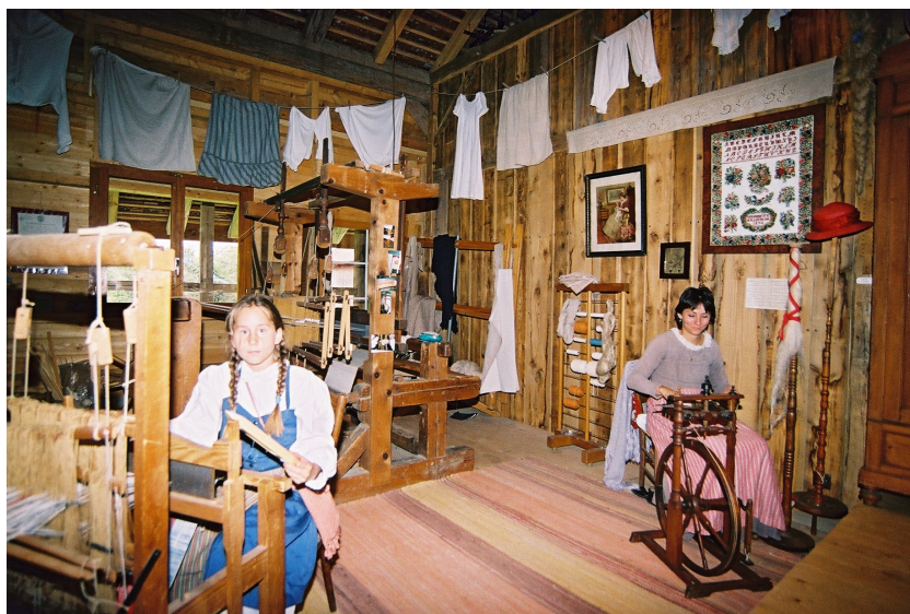
" Jorat Souviens-toi " - Ferme des Troncs

Après 500 m., à l'entrée de la forêt des Riaux, à la croisée des chemins, suivez la signalisation pédestre «falaises-grottes 5min.» Vous y découvrez les anciennes carrières dont la molasse a servi à la construction de la cathédrale de Lausanne. Trois belles grottes, creusées dans la molasse, feront la joie des enfants et de belles places de pic-nic vous attendent. Revenez sur le sentier du «Bois des Riaux», plutôt difficile pour les poussettes (chemin boueux) et en sortant du bois, poursuivez dans un joli quartier de villas des «Cullayes». Vers le collège, suivez à droite en direction de Mézières et passez devant l'EMS le Signal. A env.200 m. à votre gauche, suivez le chemin pédestre entrant dans la forêt «les Bois de la Côte» que vous traversez sur 1.5 km. afin d'arriver à la «Ferme des Troncs». Cette ferme-musée, entretenue par l'association «Jorat Souviens-toi» a pour but de sauvegarder les métiers d'antan et de maintenir les traditions. Elle est toute la mémoire de notre ancien Jorat. Le parcours se poursuit, par un joli chemin de campagne, jusqu'à la route Les Cullayes-Mézières. Revenez sur la route menant au terrain de foot tout en faisant attention aux voitures!